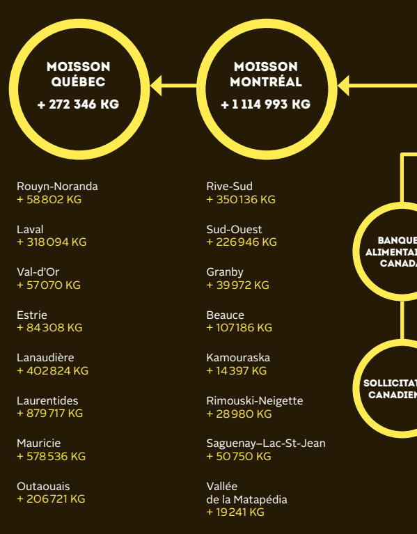
Note: Les règles comptables ne permettent pas de donner la valeur réelle des denrées récupérées, soit 3 696 025 kg à 5,50 $ le kg.